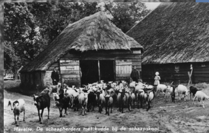
Havelte. De schaapherders met kudde bij de schaapskooi